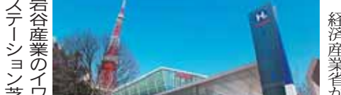
JXTGエネルギーのセルフ充填水素ステーション